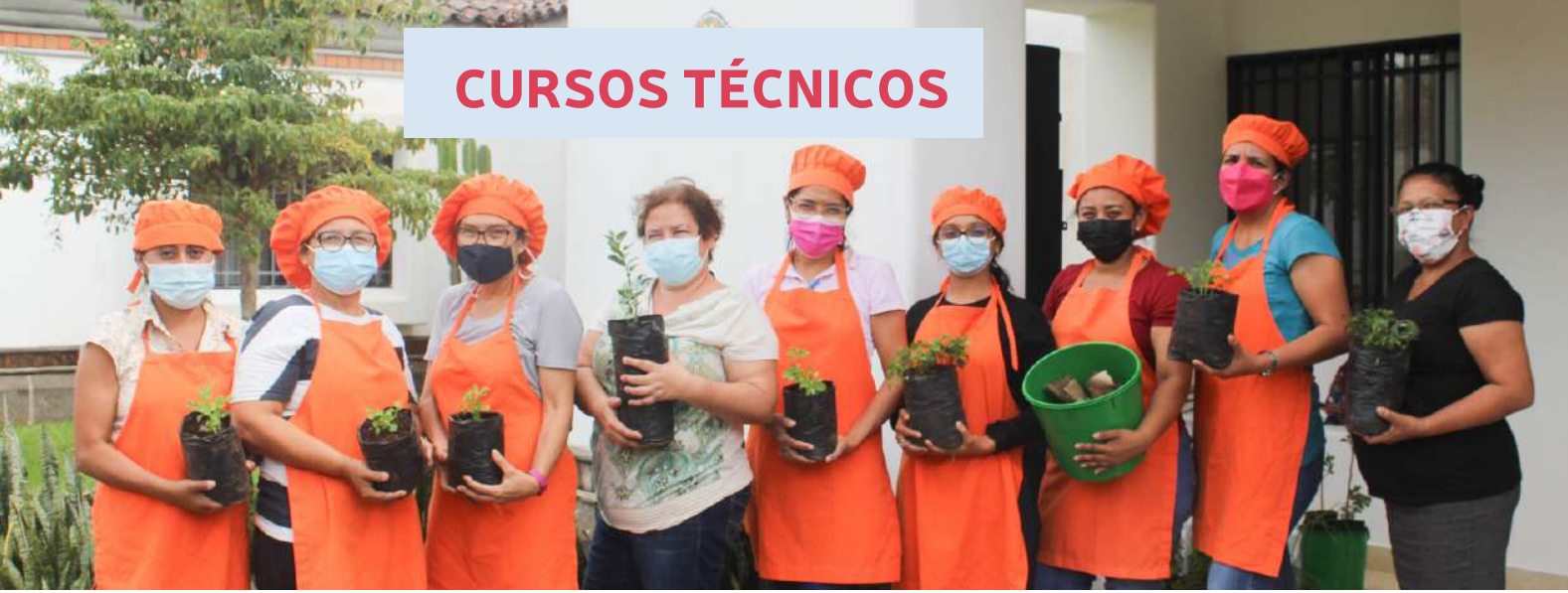
Alumnas del Curso Técnico en Cocina