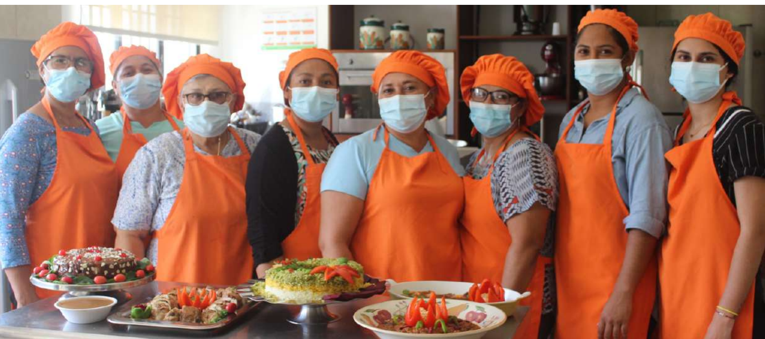
Platillos realizados durante el Curso Técnico de Cocina

Este proyecto se lleva a cabo gracias al valioso apoyo del Gobierno de Australia y a Reledev.