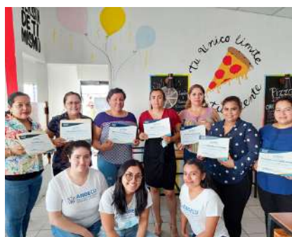
Emprendedoras del programa FME

Las facilitadoras de cada grupo llamadas “multiplicadoras” expresaron que las emprendedoras no eran las mismas que conocieron el primer día de clases, ahora son más seguras al hablar y exponer sus ideas, usan terminologías propias de la administración de un negocio, tienen mayor apropiación de las redes sociales principalmente Facebook y WhatsApp para promover sus negocios y atender a sus clientes. Sumado a esto lograron diseñar sus logos, aprendieron a desarrollar una línea gráfica para sus emprendimientos y hacer ejercicios sobre cálculos de costo de sus productos. Pero el principal logro que han tenido es la creación de una red de apoyo donde se conocen más, comparten experiencias y crean alianzas.